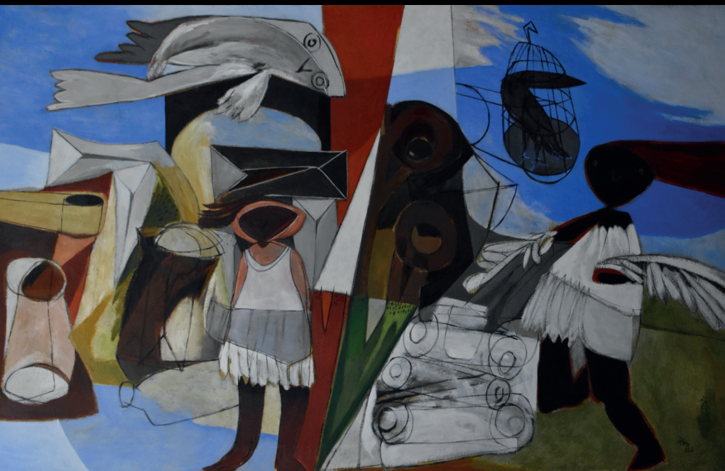
Enrique Barajas Pro, Río de sal , óleo/tela, 60 x 100 cm